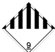
Nalepka nr 9